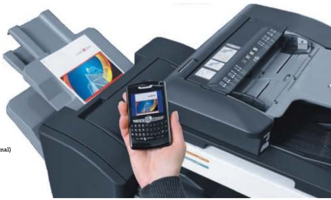
Impresión desde móvil por conexión blutetooth (opcional)