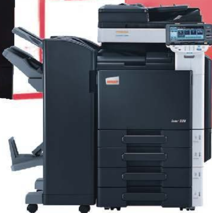
ineo+ 220 con alimentador de documentos (DF-617), finalizador (FS-527) con unidad de plegado opcional (SD-509) y pedestal con 2 bandejas universales de 500 hojas (PC-207)