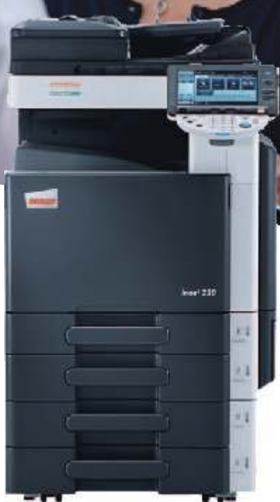
ineo+ 220 con alimentador de documentos (DF-617) y pedestal con 2 bandejas universales de 500 hojas (PC-207)