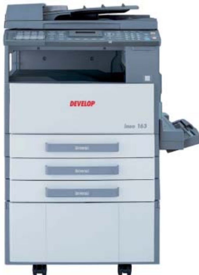
ineo 163 con alimentador de originales DF-502, bandeja bypass múltiple MB-501 y pequeño mueble SCD-21 con dos cassettes de papel PF-502

ineo 163/213 es la opción lógica para los trabajadores de pequeñas oficinas u oficinas domésticas, usuarios de fotocopadoras analógicas que necesiten más funcionalidades o usuarios de impresoras de chorro de tinta que quieran ahorrar tiempo y dinero, responsables de oficinas interesados en disponer de impresión y escaneado en red, y empresas de tamaño medio que busquen más que A4. Este dispositivo compacto y multifuncional les ofrece todo eso con una excelente relación calidad/precio.